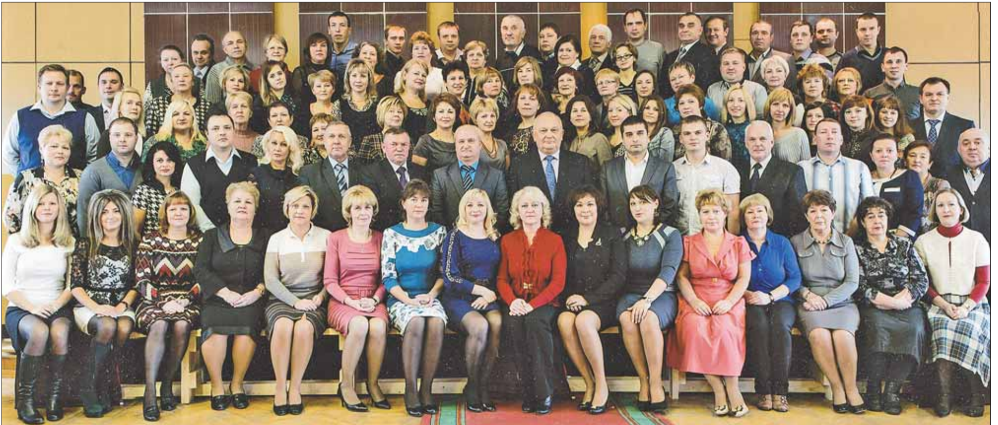
Коллектив заводоуправления. 2014 год.