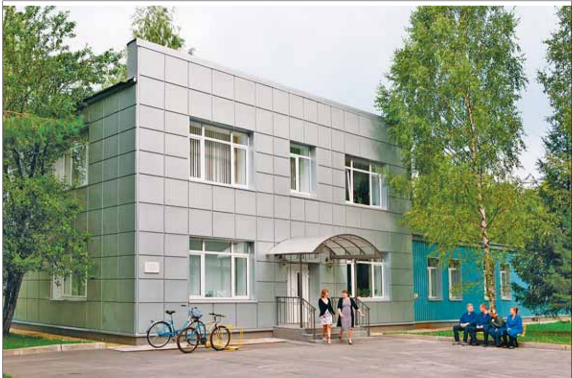
Одно из зданий основного производства

В.Н. БОГОМОЛОВ