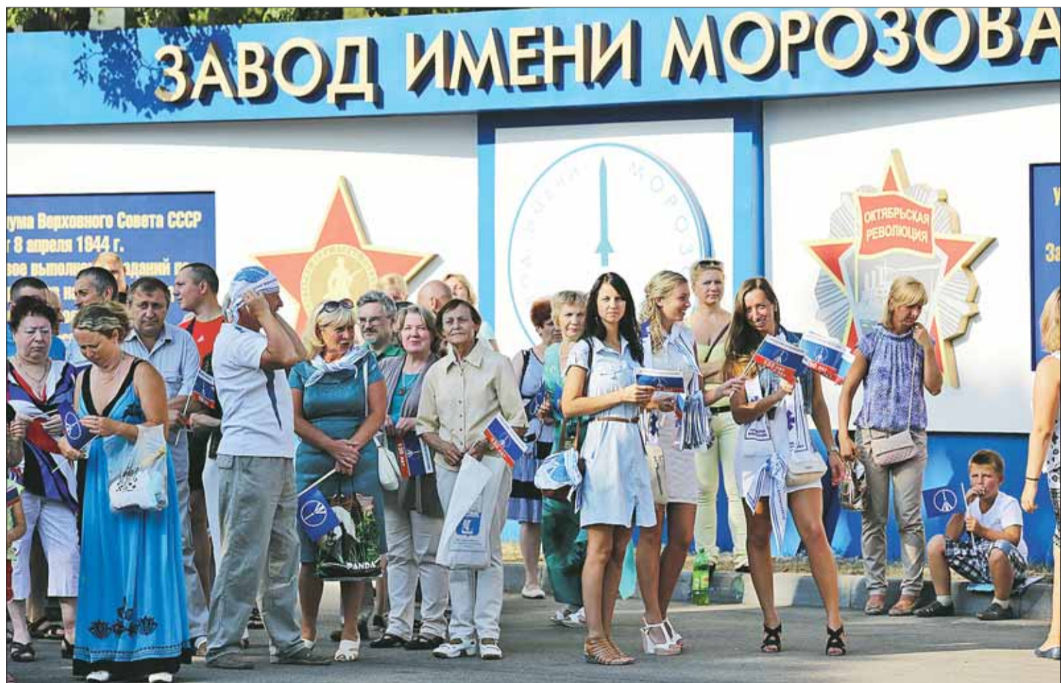
На праздновании 130-летия завода имени Морозова