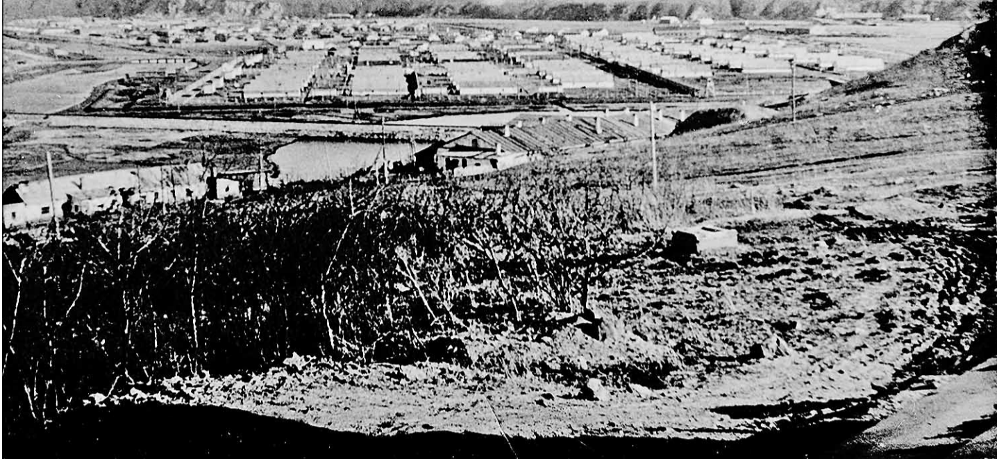
Владивостокский ИТЛ. 1940 год. Единовременно Владлаг мог принять свыше 56 тысяч заключенных, занятых на строительстве водохранилища, военных объектов и предприятий по переработке рыбы

ЦК Азербайджана: как можете подписывать документы на аресты и расстрелы, где даже нет фамилий, а только цифры подлежащих аресту и расстрелу? Тот промолчал.