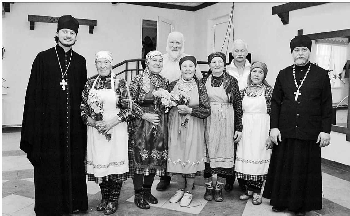
Снимок на память с бурановскими бабушками

Камбарский район расположен в юго-восточной части Удмуртии, граничит с Башкирией и Пермской областью. Население района – многонациональное, 4,5% составляют удмурты, 83,5%