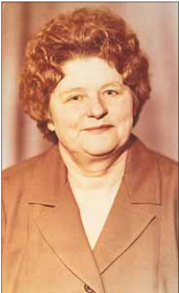
Фото с Доски почёта. 1978 год.