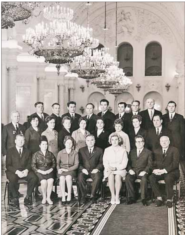
Всероссийское совещание председателей исполкомов сельских и поселковых Советов депутатов трудящихся. Москва. Кремль, 1970 год.