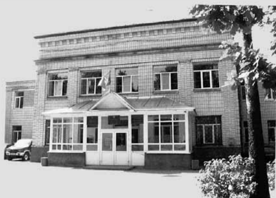
Администрация района сообщает