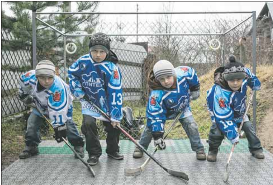
Два Николая и близнецы.

А дни рождения обоих Николаев почему-то часто выпадают на турниры, тогда и поздравления принимают от всего коллектива.