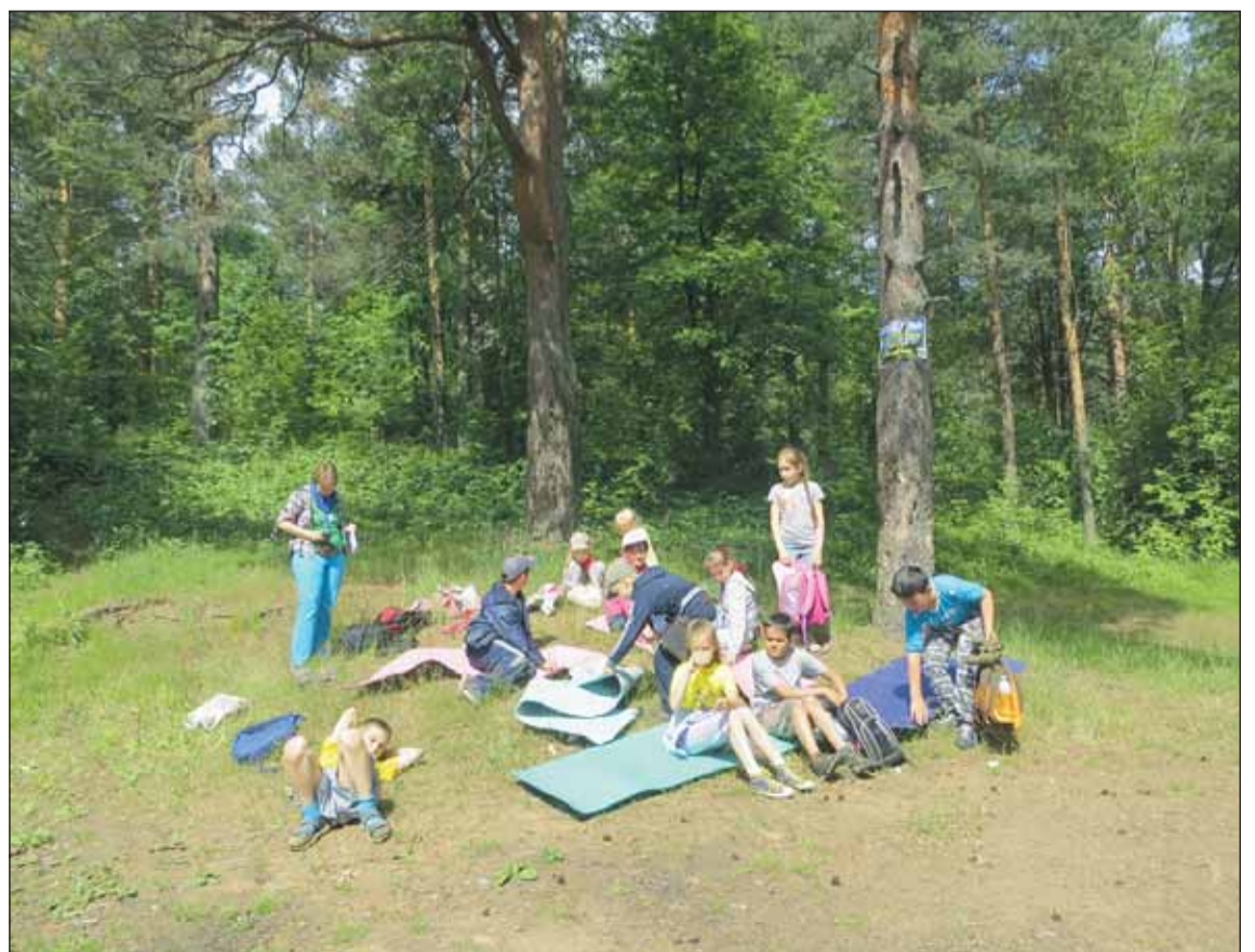
Отдых после работы в лесу.

Время не стоит на месте. Разрабатываются новые технологии, которые наши лесоводы берут себе на вооружение. Наглядный пример: открытие селекционно-семеноводческого центра, где ежегодно можно выращивать до 8 миллионов семян сосны и ели. Среди очевидных преимуществ центра – почти стопроцентная приживаемость семян, быстрый рост молодых деревьев, возможность проводить лесовосстановление не только весной и осенью (как это происходит с сеянцами из обычных питомников), но и в течение всего лета.