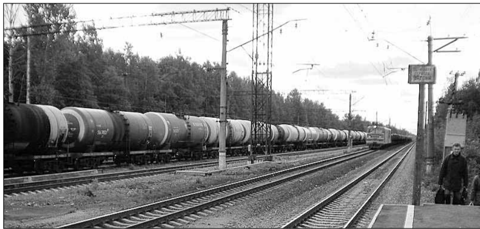
Так выглядит станция Капитолово в наши дни.