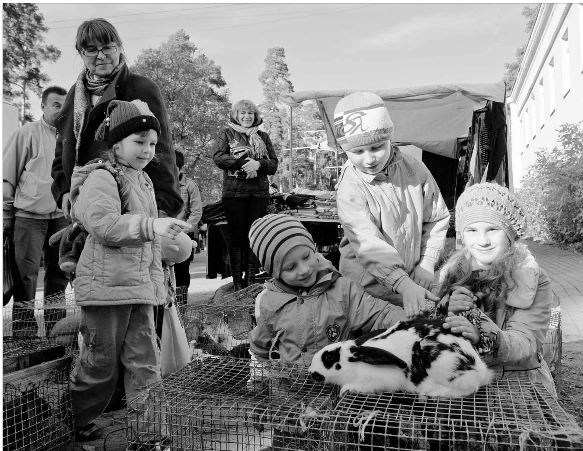
В минувшие выходные во Всеволожске прошла ежегодная Районная сельскохозяйственная ярмарка. Подробный материал будет опубликован в следующем номере.