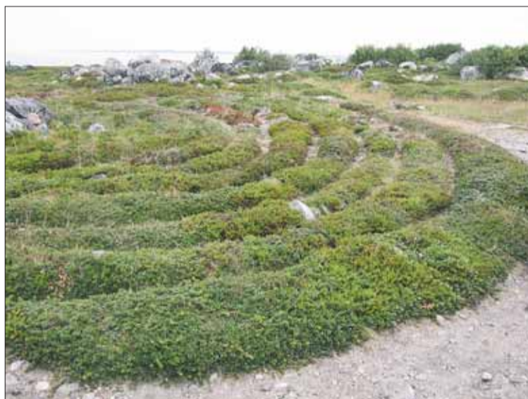
Один из лабиринтов Соловецких островов

Земля может повернуться не только от удара небесного скитальца. Когда снеговой покров Гренландии, растущий год от года, дойдёт до определённой массы, произойдёт очередная всемирная катастрофа. Европа может оказаться морским дном. Правда, в России будет сплошной курорт. Сейчас Гренландию сдерживает шельф в районе Новосибир-