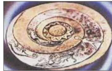
Одна из таинственных археологических находок

Развалив Союз, мы теперь ищем Объединяющую идею, которая сплотила бы народ, дала ему ЦЕЛЬ. Да, мы живём в исключительно трудное время, в эпоху серьезных внешних и внутренних вызовов нашему государству. И все, для кого судьба России небезразлична, это понимают. Разговор об Объединительной идее идёт не один год. Он всё чаще выплёскивается на телеэкран, особенно в проекте «Поединок» Владимира Соловьёва. Но говорят об этой идее как бы между прочим,