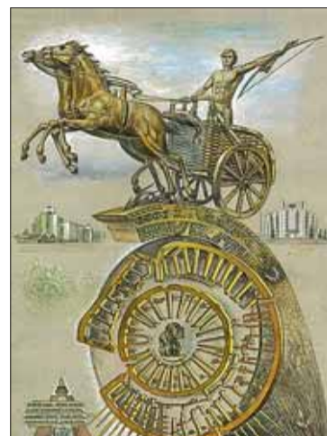
Проект памятника первой цивилизации на Урале

не целенаправленно. Иногда говорят, но как-то неуверенно, о необходимости положить в основу идеи историю России. А почему бы и нет? Только надо вначале прийти к единому её трактованию. Слишком много появилось у нас учебников по истории и слишком много в них разночтений. Речь не о восстановлении цензуры. Просто пришла пора отсеять зёрна от плевел – прийти к единой оценке фактов и действующих лиц. Высказывается мнение о том, что историю надо сделать главным школьным и вузовским предметом. Воспитывать в школьниках и студентах, прежде всего, ГРАЖДАНИНА. И начинать воспитание с детского сада, вселяя в детские сердца любовь к Отечеству, гордость за него. Надо отвращать детей от потребительских идеалов, бездумных «стрелялок» и «страшилок», воспитывать в них ПАТРИОТИЗМ. Такое воспитание – надёжная основа для укрепления дружбы между детьми, коллективизма, уважительного отношения к старшим, дисциплины. Патриотизм – это и надёжная основа для сплочения российского народа.