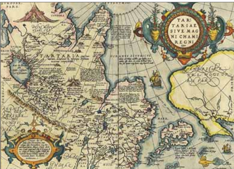
Древняя карта охватывает территорию нынешней России

В 20-годах прошлого столетия немецкий учёный Альфред Вегенер выдвинул литосферную теорию земных катастроф. Она рассматривает быстрое, практически мгновенное перемещение литосферных плит, а с ними и материков, при котором Земля «кувыркается», меняются положения полюсов, и наступает очередной конец света. Но в реальности не положение полюсов меняется, а очередной континент «подъезжает» под полюс. Такое может произойти, если какое-то крупное космическое тело ударило Землю не в лоб (Мексиканский залив, Антарктида), а по касательной. Твёрдые литосферные