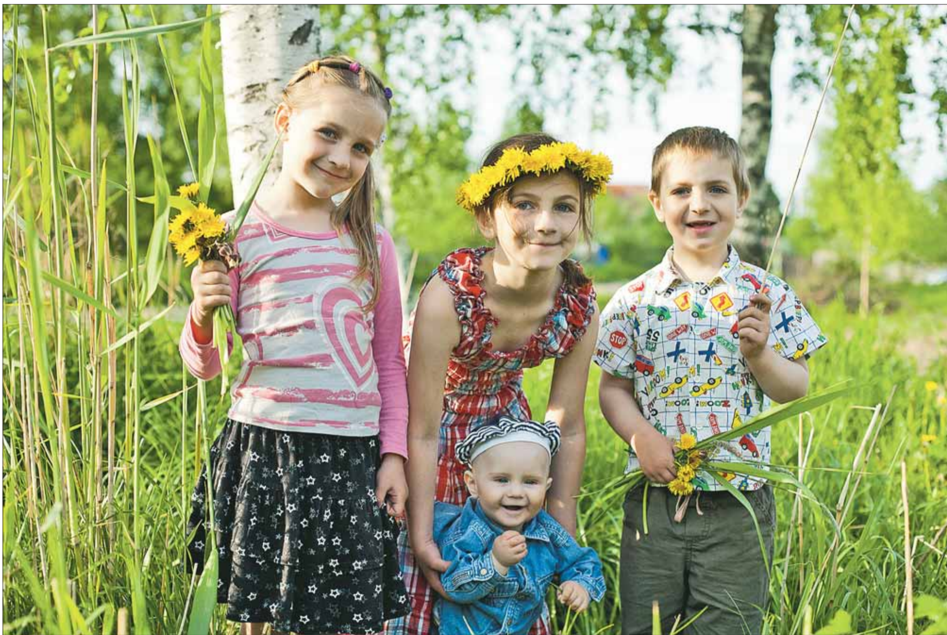
1 июня – Международный день защиты детей. На снимке – дети семьи Кораблёвых.