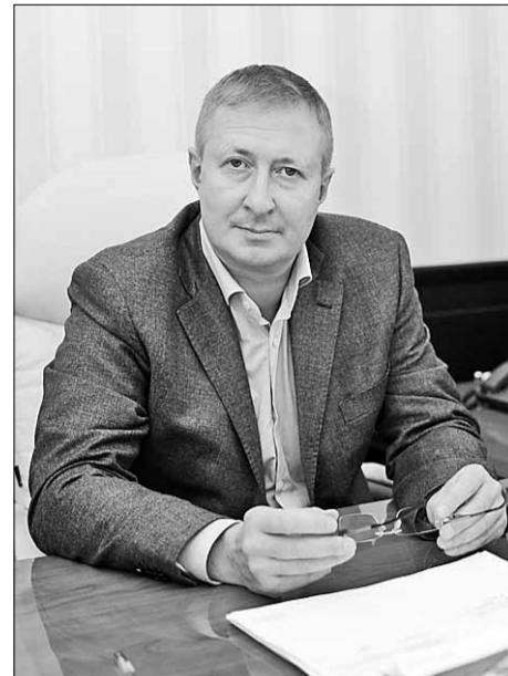
нителю, но и их «хозяев»?

– Вы пресекаете подобную деятельность. А удаётся ли вам прекращать противоправную деятельность не только мелких исполнителей и распростра-