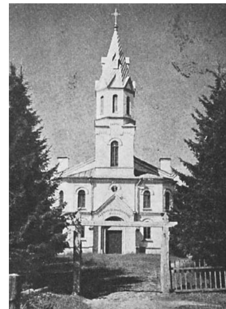
Снимок 1911 года.