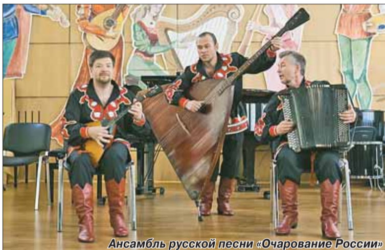
Ансамбль русской песни «Очарование России»

Накануне государственного праздника – Дня России – в концертном зале Всеволожской детской школы искусств им. М. И. Глинки состоялось торжественное награждение победителей фестиваля творчества преподавателей учреждений дополнительного образования детей; здесь же чествовали лауреатов и дипломантов Всеволожского районного конкурса на лучшее поэтическое и музыкальное произведение о родном крае «Всеволожские росы» – одного из главных событий Третьего районного межмуниципального фестиваля культурных инициатив «Вдохновение». А через два дня в живописном уголке, возле микрорайона Южный, загорелись костры и зазвучали песни бардов, собравшихся на свой традиционный фестиваль «Соцветие», организованный городским отделом культуры и старейшим в стране клубом авторской песни «Восток».