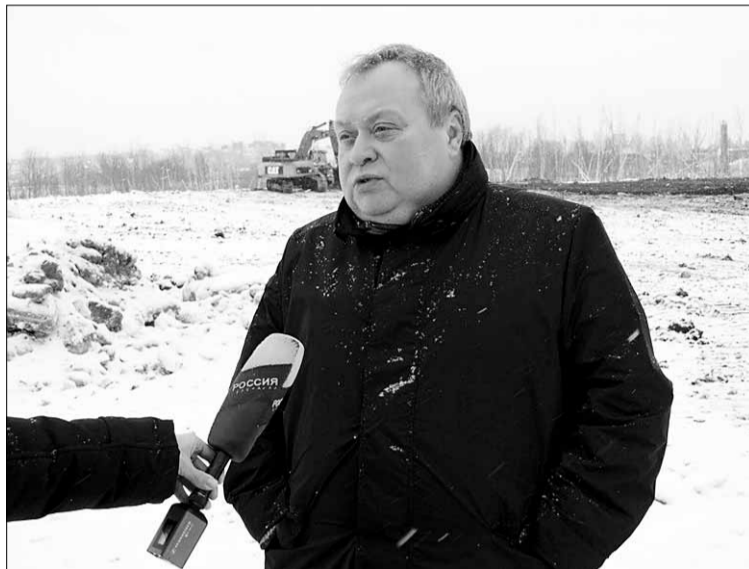
УК РФ (порча земли).

Кроме того, управление Россельхознадзора по Петербургу и Ленобласти провело анализ 6 проб, взятых с участка ЗАО «Выборгское» и выявило превышение некоторых веществ. В частности, в одной пробе содержание мышьяка превысило уровень предельно допустимой концентрации в 3,41 раза, а цинка – в 2,25 раза. По данному факту межрайонный природоохранный прокурор направил в УМВД по Всеволожскому району постановление для решения вопроса об уголовном преследовании по ч. 1 ст. 254