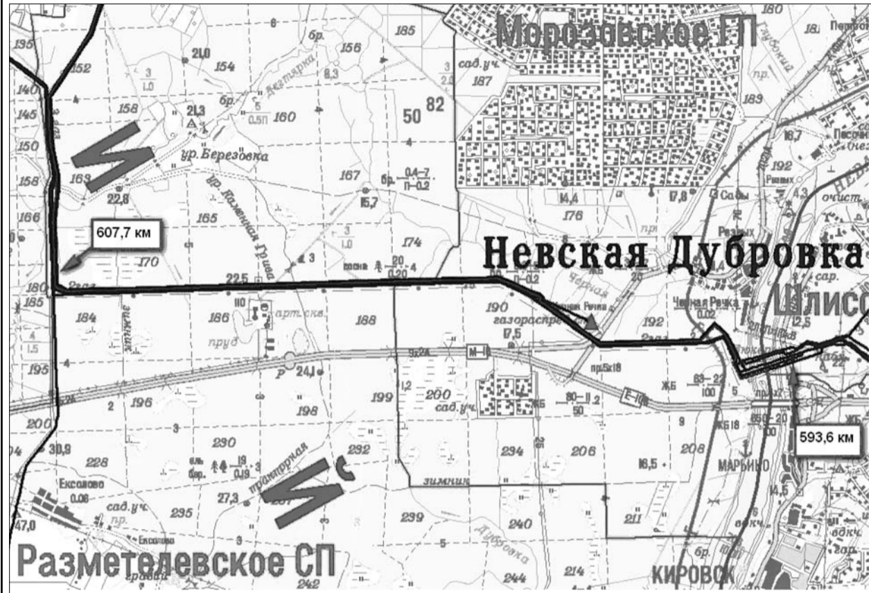
Просим всех землепользователей, по земельным участкам которых проходит трасса существующего магистрального газопровода «Грязовец – Ленинград 1 н» 593,6 – 607,7 км во Всеволожском р-не Ленинградской области, обращаться по адресу: 196128, г. Санкт-Петербург, ул. Варшавская, д. 3

В целях осуществления мероприятий, направленных на предупреждение потенциальных аварий и катастроф, ликвидацию их последствий на объектах Единой системы газоснабжения, ООО «Газпром трансгаз Санкт-Петербург» уведомляет землепользователей (землевладельцев) о временном занятии земельных участков, для проведения капитального ремонта МГ «Грязовец – Ленинград» 1 н с 593,6 км по 607,7 км в районе н.п. Чёрная Речка Морозовского г.п. Всеволожского района. ООО «Газпром трансгаз Санкт-Петербург» гарантирует возмещение убытков землепользователям (землевладельцам) при условии предоставления правоустанавливающих документов на земельные участки, подлежащие временному занятию.