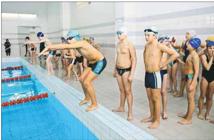
Соревнования по плаванию, которые прошли в СОШ № 6 в рамках областной Спартакиады школьников

С 29 по 31 марта в городе Сосновый Бор проходил Межрегиональный турнир по художественной гимнастике «Грация». В соревнованиях принимали участие 92 участника. От Всеволожской ДЮСШ выступали 3 спортсмена. Призовых мест не заняли.