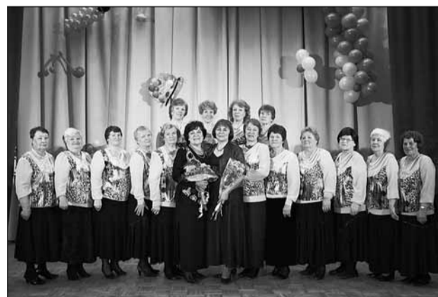
26 мая состоялась 4-й отчетный концерт хорового коллектива «Радоница» (Колтушское сельское поселение). Руководитель – Елена Чернова.