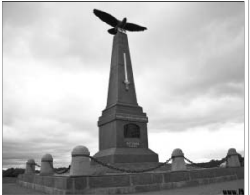
На священной земле Бородино.