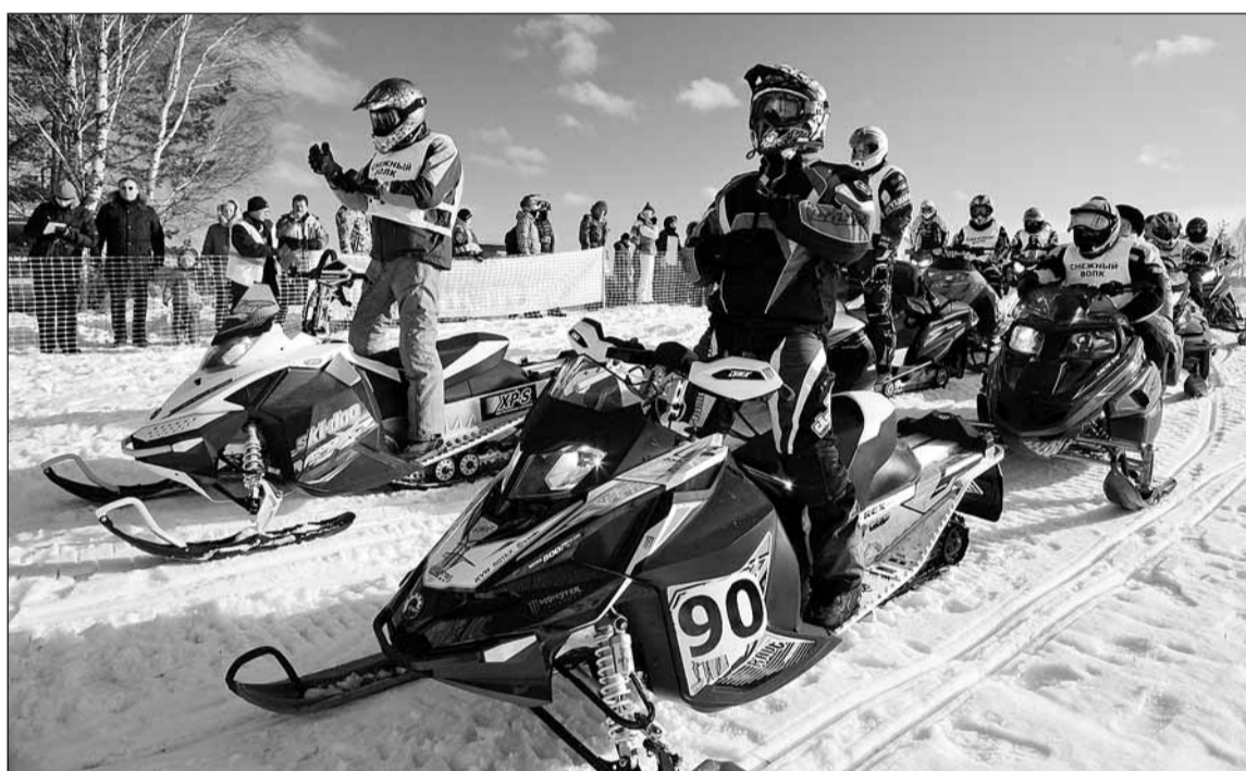
В начале марта в окрестностях г. Всеволожска состоялись Открытый чемпионат России и второй этап Открытого лично-командного чемпионата Санкт-Петербурга по кантри-кроссу на снегоходах. Материал читайте на 7-й странице.