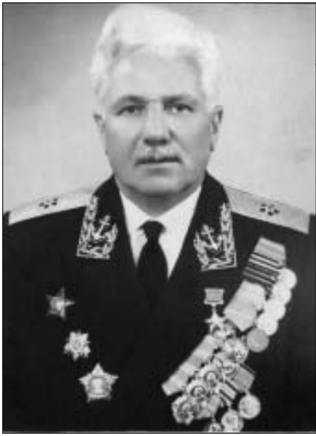
Герой Советского Союза, контр-адмирал В. К. Коновалов.