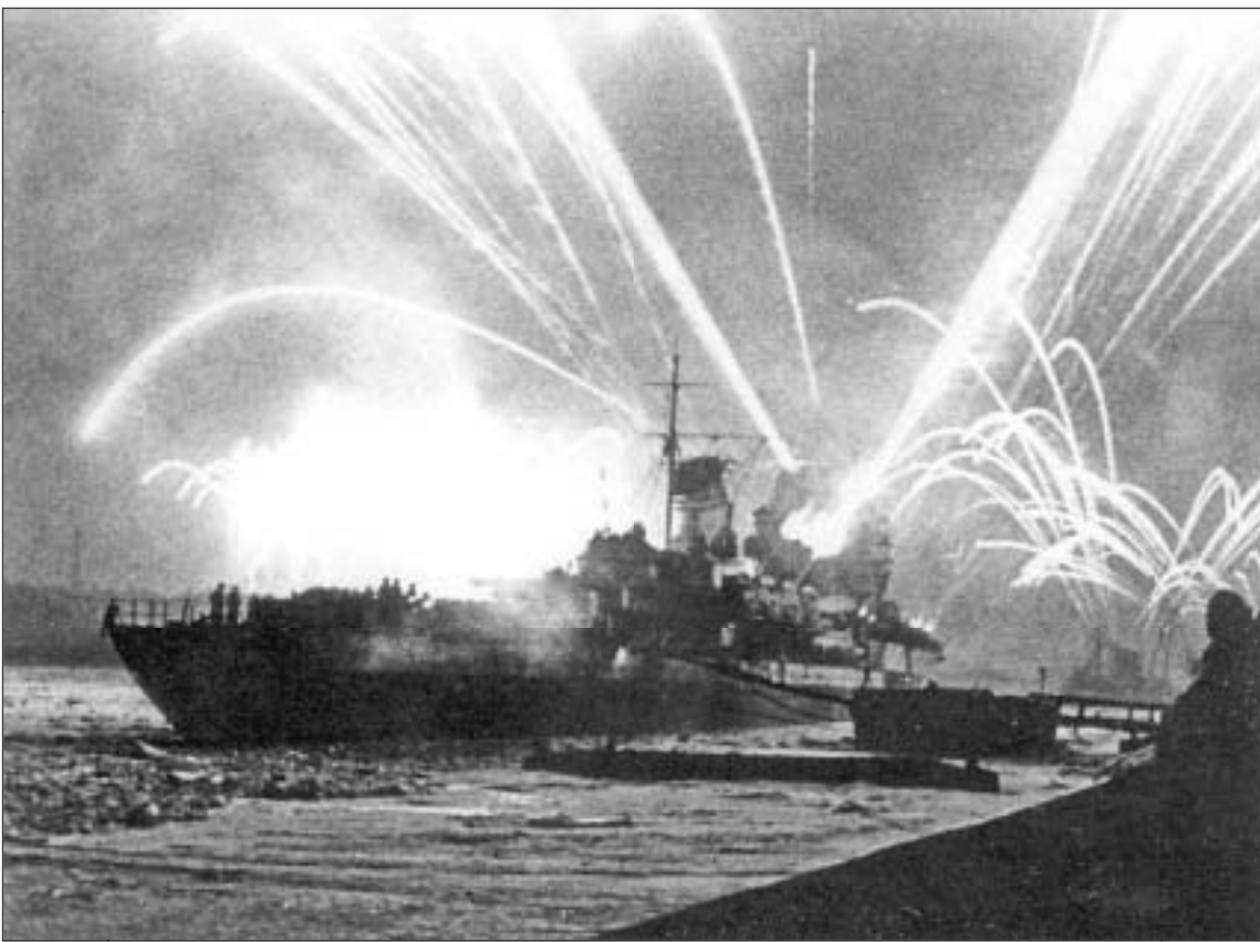
Крейсер «Киров» салюетует в честь окончательного снятия блокады города на Неве 27 января 1944 года.