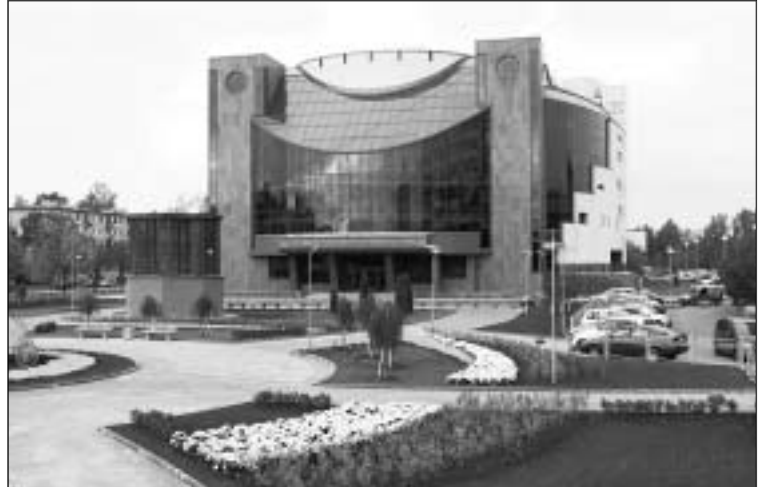
Новое здание Театра «Буфф»

Штокбант. Да, смеющийся, или «он засмеется». Библейское имя. Мои родители даже сражались за это имя в загсе. Принято было называть Владимира, в крайнем случае – Вольдемар, а мои приходят – Исаак! Что за Исаак такой?! И я хочу вот еще что