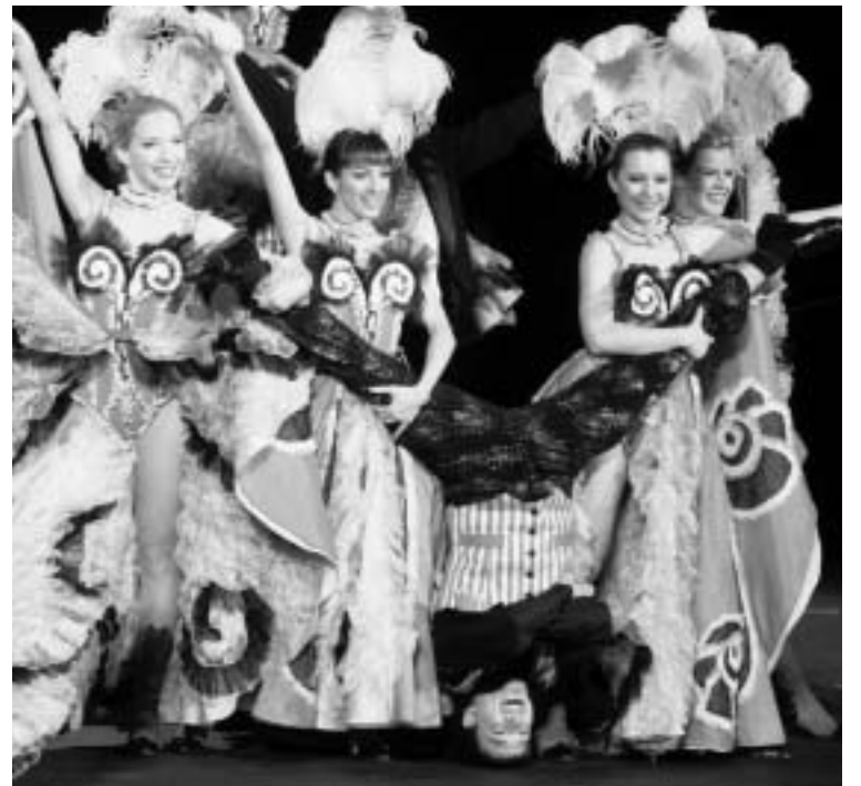
Сцена из праздничного представления.