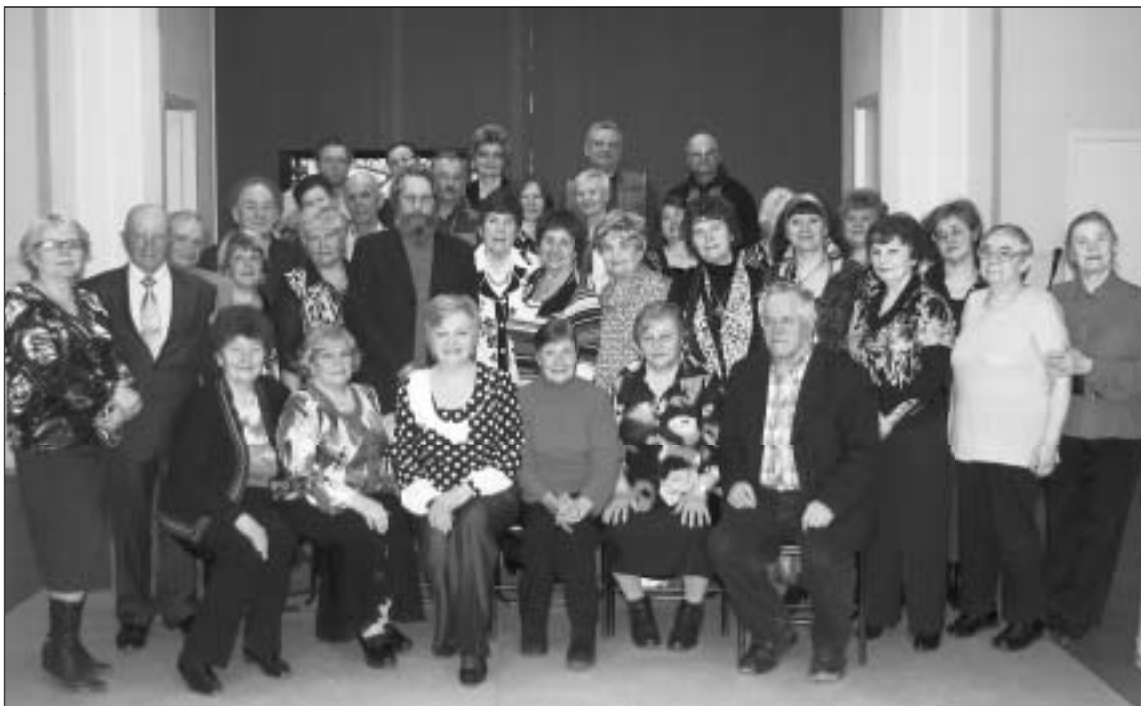
На снимке: участники музыкально-поэтического салона «Родник», который уже десять лет существует во Всеволожском Доме культуры. Материалы, посвящённые Дню работника культуры, читайте на 2-й – 7-й страницах.