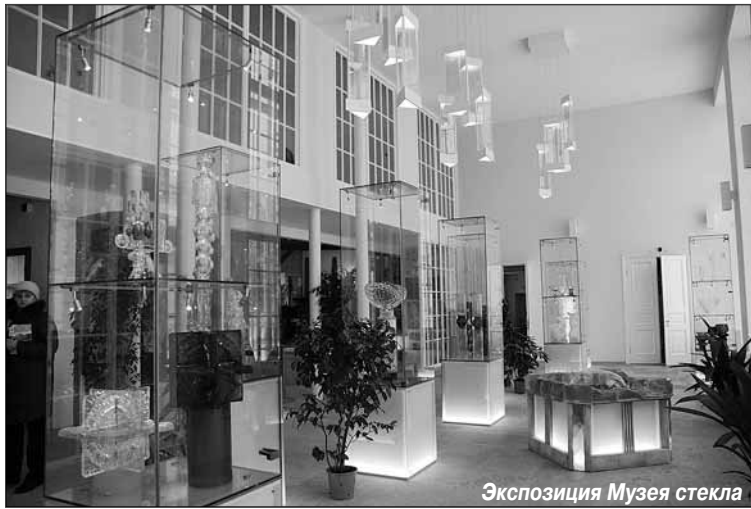
Экспозиция Музея стекла