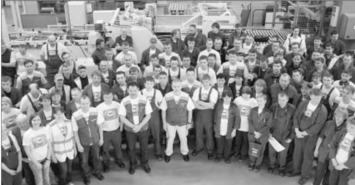
Коллектив компании ЗАО «Смерфит Каппа Санкт-Петербург»

28 апреля Международной организацией труда (International Labour Organization, ILO, русск. МОТ) был объявлен Всемирным днем охраны труда (World Day for Safety and Health at Work) с целью привлечения внимания мировой общественности к масштабам проблемы, а также к тому, каким образом создание и продвижение культуры безопасной работы может способствовать снижению количества несчастных случаев и ежегодной смертности на работе.