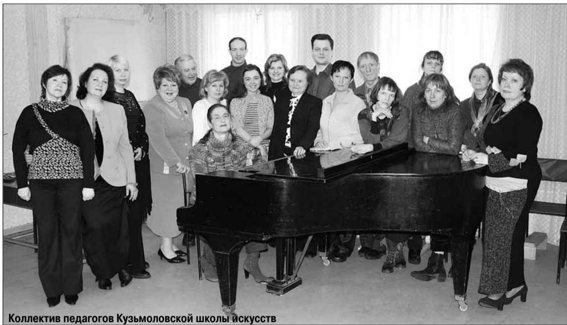
Коллектив педагогов Кузьмолловской школы искусств