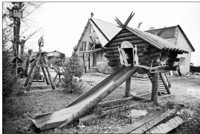
Такую вот избушку на курьих ножках увидели мы в Порошкино