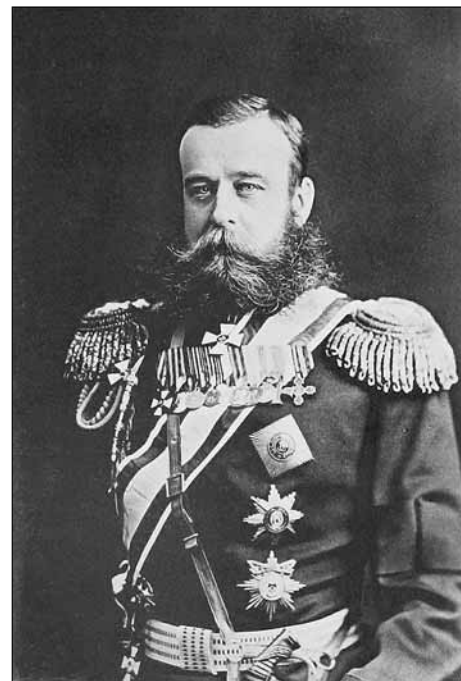
Генерал М.Д. Скобелев

нерал-майора Н.Г. Столетова). Вечером в Софии у памятника Царю-Освободителю Александру Второму идёт торжественная служба. Надпись на этом памятнике гласит: «В царствование Александра Второго – императора Всероссийского волею и любовью его освобождена Болгария». С 1878 года и по сей день во время Великого входа Литургии верных (очень важная часть православного обряда) в православных храмах Болгарии поминается Александр Второй и все русские воины, павшие на поле боя за освобождение этой страны.