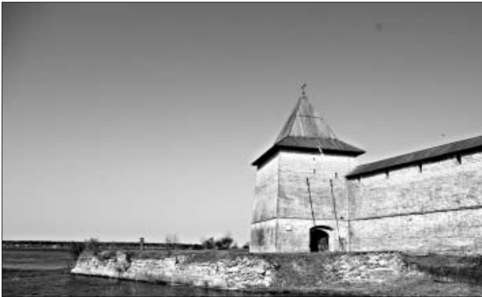
Примерно так крепость Орешек выглядела и в середине 19 века.