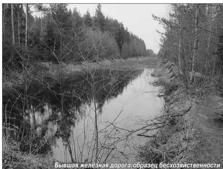
Бывшая железная дорога, образец бесхозяйственности

перекрыли дорогу трактором, чтобы отрезать путь к бегству, и вызвали подмогу.