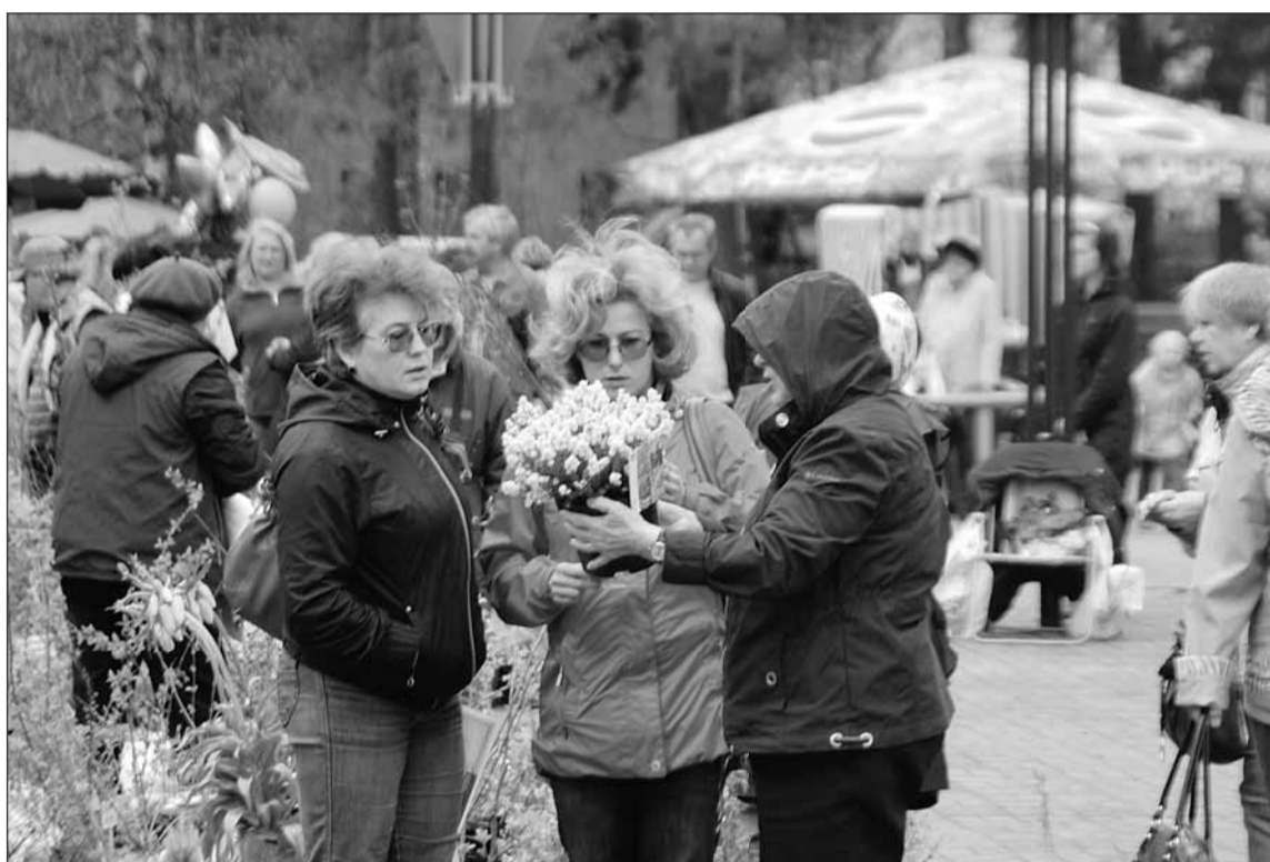
Во Всеволожке прошла ежегодная весенняя районная ярмарка. Материал читайте на 3-й странице.