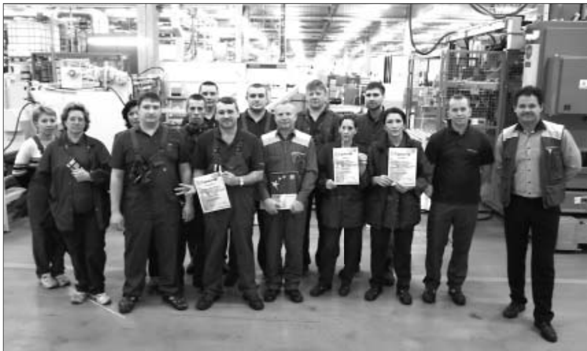
НА СНИМКЕ: победители производственного соревнования «Смерфит Каппа Санкт-Петербург». Материал читайте на 3-й странице.