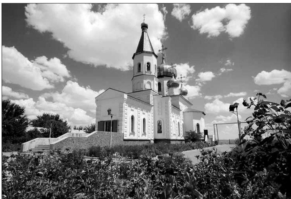
Байконур. Храм Георгия Победоносца

монастырь в Санкт-Петербурге, – рассказал мне Олег Мухин. – Рассчитывали там побыть минут 15, но так увлеклись разговором с игуменьей Софией, что задержались на два часа. Помню, там я услышал от Г.С. Титова его знаменитую фразу: «Мы все – космонавты и находимся на огромном корабле под названием «Земля»».