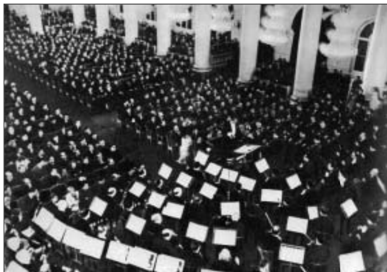
Зал, где звучал Шостакович.

Утром 17 сентября 1941 года Шостакович завершил первые две части симфонии. Еще неделя ушла на третью часть, писались по 30 – 35 страниц партитуры в день. Бомбежки и обстрелы не прекращались. Композитор слабел от недоедания. Условия работы значения не имели: писал в любой обстановке – важ-