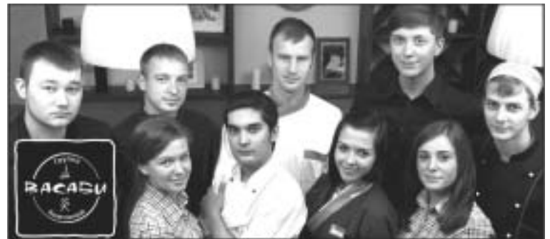
Ресторан "ВАСАБИ" во Всеволожске