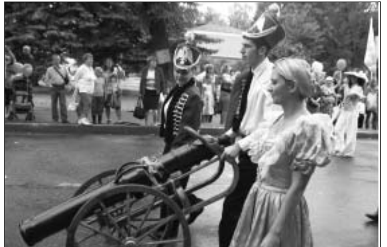
НА СНИМКАХ: слева – губернатор открывает праздник; справа по вертикали – участники торжеств из нашего района.