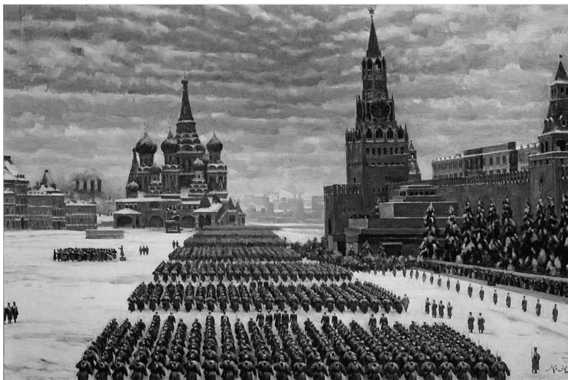
Парад на Красной площади 7 ноября 1941 года