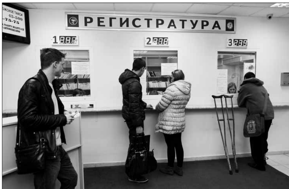
(Окончание. Начало на 3-й стр.)

Что касается дальнейших наших перспектив по техническому перевооружению: сейчас мы планируем приобрести передвижной маммограф, который крайне необходим для ранней диагностики онкологии, затем на очереди – передвижной флюорограф. Таким образом мы сможем вообще по максимуму обследовать население на их же территории, то есть людям не надо ездить в поликлинику, потому что МЕДИЦИНА ПРИШЛА К ВАМ ДОМОЙ!