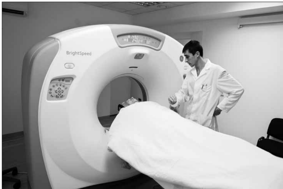
Обследование на томографе

В «Новом Оккервиле» мы пошли другим путем. Мы заключили с собственником новых зданий договор, и он нам выделил 280 кв.м. На этих площадях открыем кабинет врача семейной практики в I квартале 2013 года. В 2013-м году мы решим вопрос и по микрорайону Южный, где никак не желают нам отдавать ведомственную поликлинику, но мы ищем варианты, и мы их найдем, есть предложения по решению