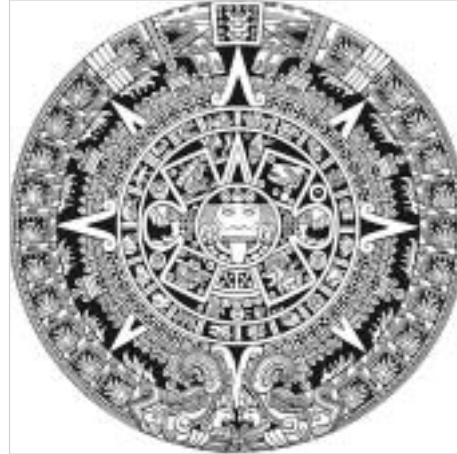
Загадочный календарь Майя

Но ведь у астрономов и археологов нет данных, что 4,5–5 тысяч лет назад, когда был предсказан суперпарад, на Земле была глобальная катастрофа. И ещё... так как наше Солнце не лежит в центральной плоскости галактики, а лежит на много световых лет выше, то для нас Млечный путь не делит небо пополам. Из-за окраинного положения Солнце проецируется не на сам центр, а на 7 градусов выше. И точка