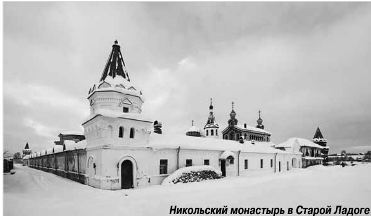
Никольский монастырь в Старой Ладогe