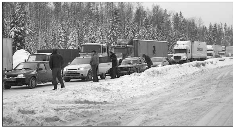
А такие заторы на дорогах России, видимо, неизбежны зимой