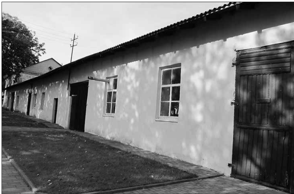
Новогрудок. Музей еврейского сопротивления.