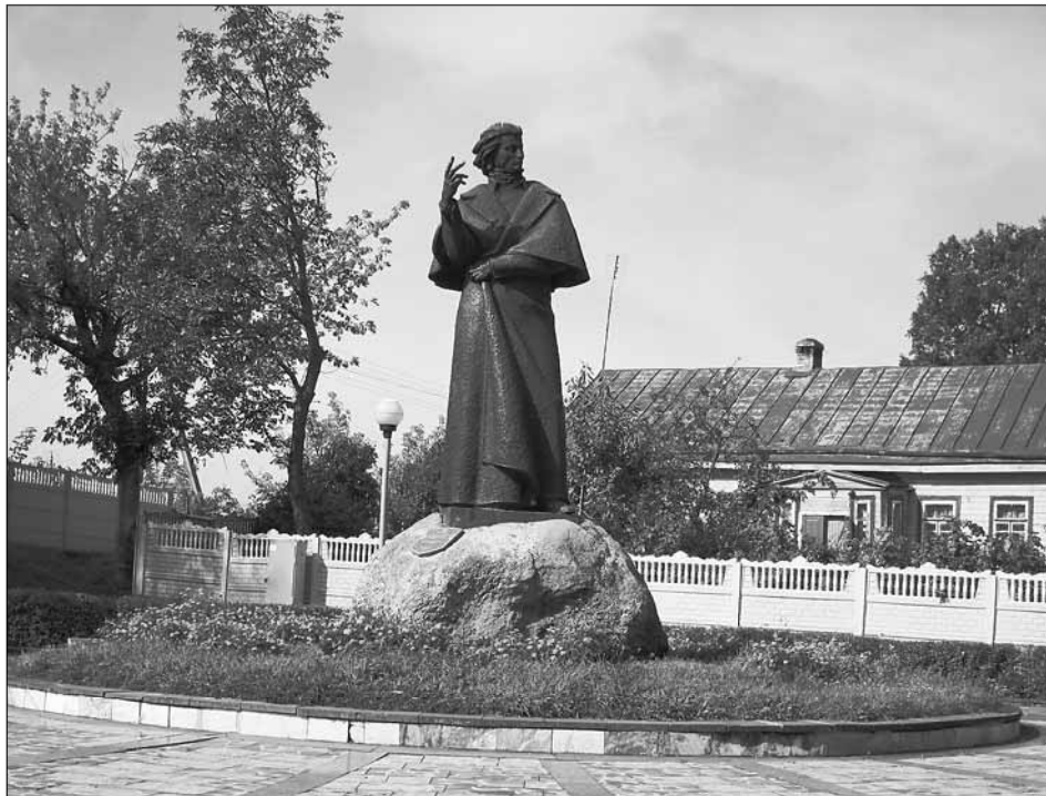
Новогрудок. Памятник Адаму Мицкевичу.

В настоящее время там проживает больше пятидесяти тысяч жителей, которые заняты в сельском хозяйстве или работают в сфере производства, которая представлена несколькими предприятиями. Наиболее крупные из них: Оп-