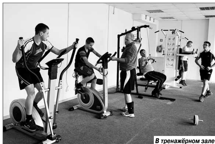
В тренажёрном зале