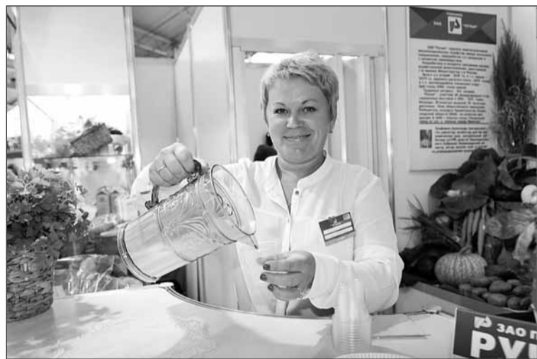
Продукция ЗАО «Племзавод «Ручьи»