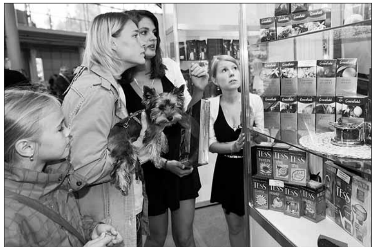
Продукция фирмы «Невские пороги»

А днём ранее в Энколово на базе конно-спортивного клуба «Дерби» в