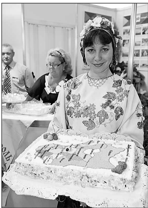
На торте – карта Всеволожского района

Кроме того, областные фермеры осуществляли уличную торговлю своей продукцией. На территории выставочного комплекса работали рыбный рынок и экспозиция «Дары земли Ленинградской». А 29 августа вообще весь день прошел под эгидой Ленинградской области. Кроме деловой части ярмарки её гостям и участникам силами творческих коллективов муниципальных районов области была представлена большая концертная программа.