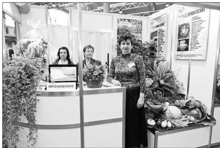
Экспозиция ЗАО «Племзавод «Приневское»