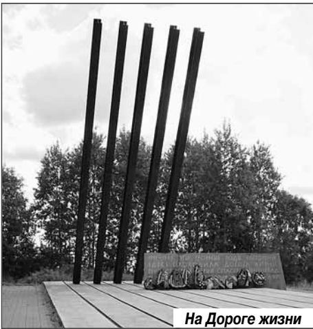
На Дороге жизни

По преданию, российская государственность зародилась в Старой Ладоге на территории Ленинградской области. В городе Волхове в 1926 году построена первая в стране Волховская ГЭС, которая в годы блокады обеспечивала электроэнергией осажденный Ленинград.