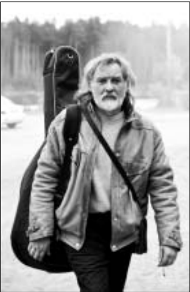
Вот он, парень с гитарой