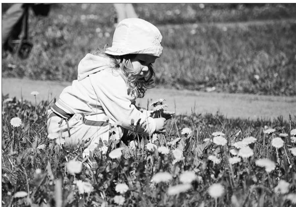
1 июня Россия отмечает День защиты детей.