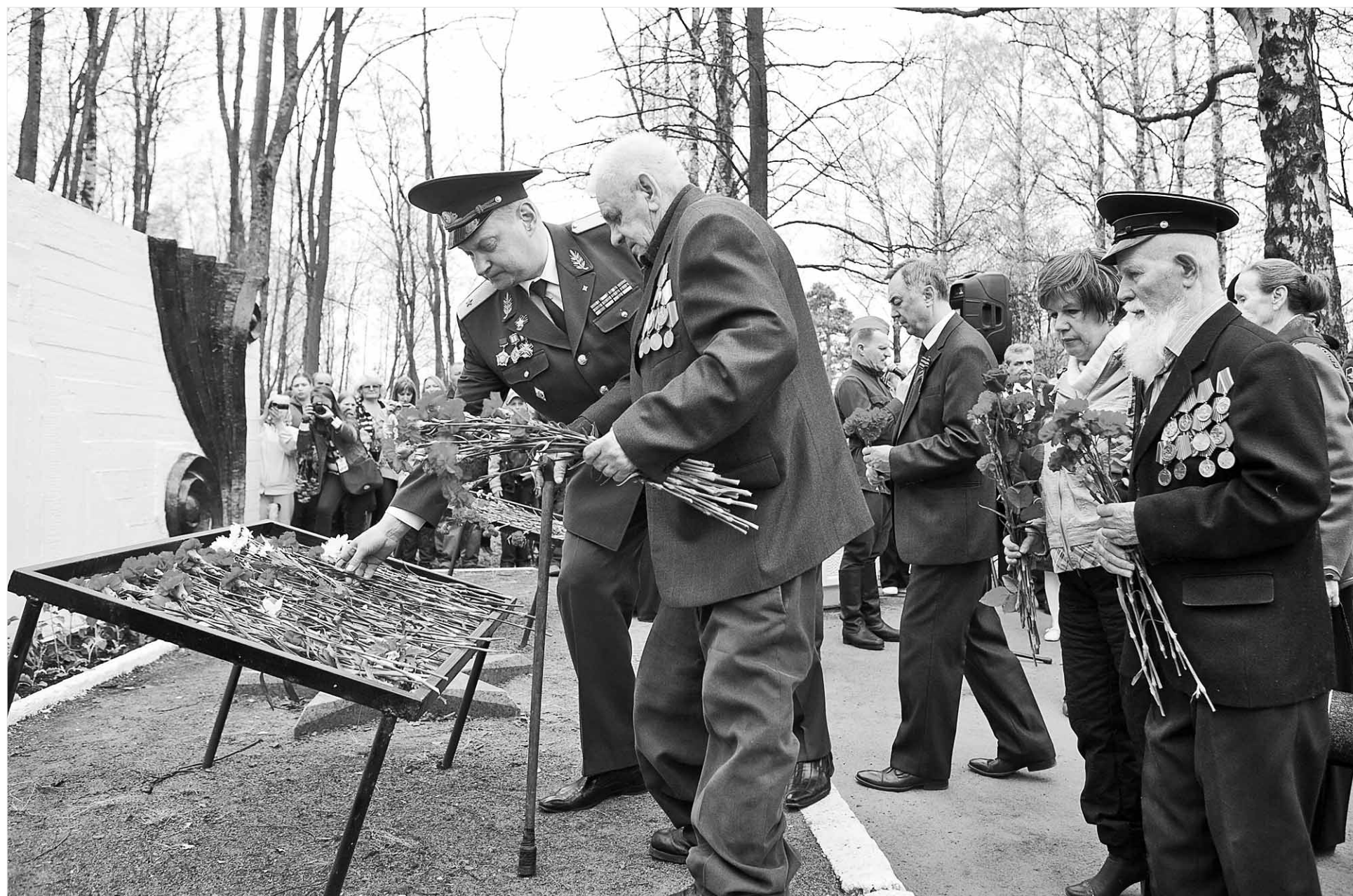
Этот снимок наш фотокорреспондент Антон Ляпин сделал 9 мая во время торжественного празднования Дня Победы во Всеволожске. Материал читайте на 2-й странице.