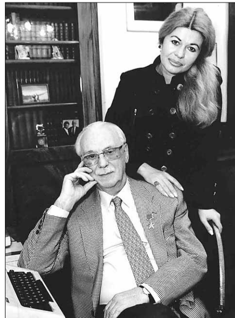
В последние годы жизни

ной обстановке: Сталин, Берия, Ворошилов и другие официальные лица. Михалков рассказывал, что Сталин был в хорошем настроении, доброжелательно шутил: «Он знал много моих стихов и просил почитать «Дядю Степу» и другие. Я читал — а он смеялся до слез, и слезы капали у него с усов».