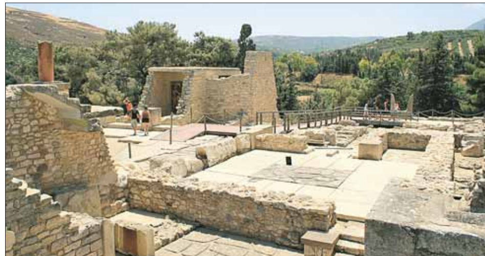
Развалины города Кносса

В среднеминойский период влияние культуры распространилось на материковую Грецию, Крит, острова Эгейского моря и ряд территорий восточного Средиземноморья.