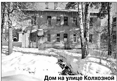
Дом на улице Колхозной

Женщины продемонстрировали официальный ответ Территориального управления Росимущества в Ленинградской области, из которого следует, что дома №№ 3, 9, 14, 14-а, 16, 16-а по улице Колхозной и дома