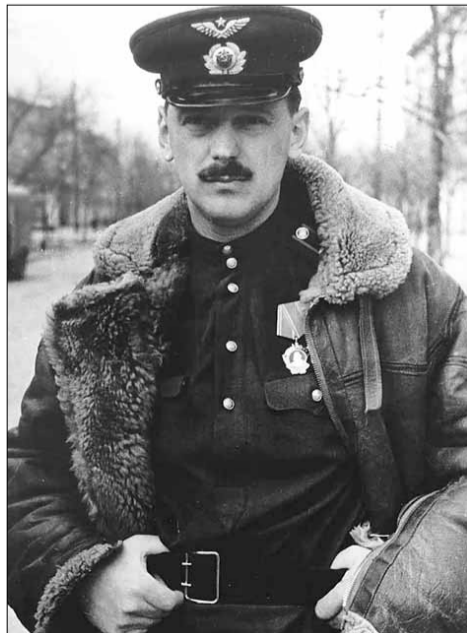
С. Михалков, военный корреспондент

В Союзе писателей, который он возглавлял более 20 лет, его называли не по имени-отчеству и не по фамилии. Михалкова все называли Классиком. И еще говорили, что на самом-то деле лучше всего его понял