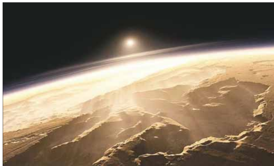
Так выглядит марсианский пейзаж

занностей премьер-министра СССР. Причиной стало возбуждение в отношении его прокуратурой уголовного дела за участие в антиконституционном заговоре. Вскоре Павлов был арестован по обвинению в государственной измене и помещен в «Матросскую тишину» для отбывания наказания (выпущен из тюрьмы в феврале 1994 года по амнистии Государственной Думы).