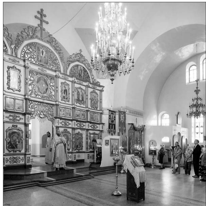
Служба в храме