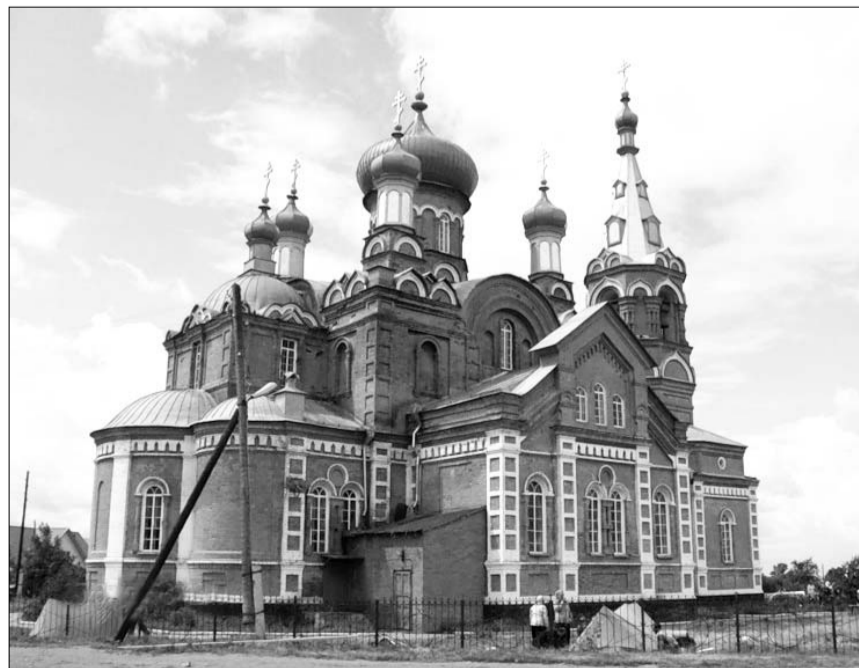
Храм в селе Коробейниково