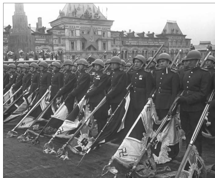
Парад Победы в Москве.