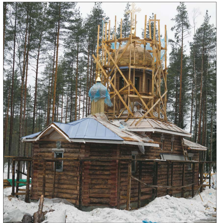
Храм в Ненимяках.

вышенности, у слияния рек, возле речной излучины или на берегу озера. Он словно освещал собою всё пространство, и ни одна постройка не могла с ним соперничать по красоте и прочности. Возвышаясь над остальными городскими постройками, храм был виден издали, радуя сердце и глаз. «Аргумент красоты», говоря словами академика Д.С. Лихачева, занимал едва ли не первое место. Князья и цари, купцы и мастеровые люди, соперничая друг с другом, старались построить и оставить после себя самый красивый, самый запоминающийся символ веры. И не было страшнее удара и тяжелее оскорбления, чем разрушенный храм... А богатство и статус населенного пункта, говоря современным языком, определялось наличием или отсутствием церкви. Если была каменная церковь, значит, богато жили, назывались селом. Нет церкви – и деревни вам хватит!