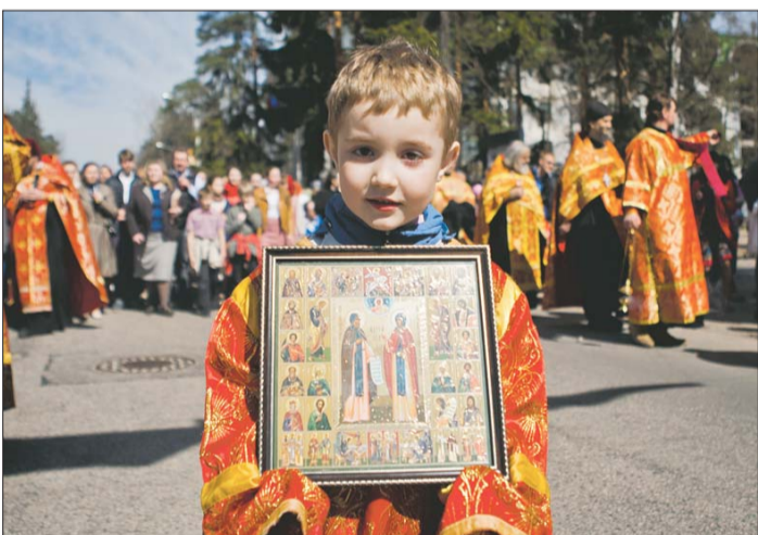
Эти снимки сделаны нашим фотокорреспондентом Антоном ЛЯПИНЫМ во время Пасхального крестного хода во Всеволожске.

Дорогие братья и сестры, поздравляю вас с праздником Святого Христова Воскресения!