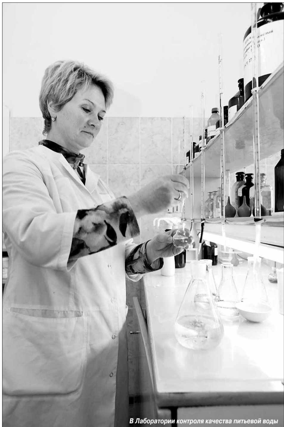
В Лаборатории контроля качества питьевой воды

чего водоснабжения, не связанной с отоплением, не имеет запаха, что подтверждается протоколами лабораторных исследований ОАО «Водотеплоснаб». Пробы горячей воды были отобраны по адресам: микрорайон Ожный, ул. Народная, детский сад – закрытая система ГВС; ул. Лубянская, дом 4 – (газовая колонка); ул. Пограничная, дом 11/1 – частный сектор (водогрей).