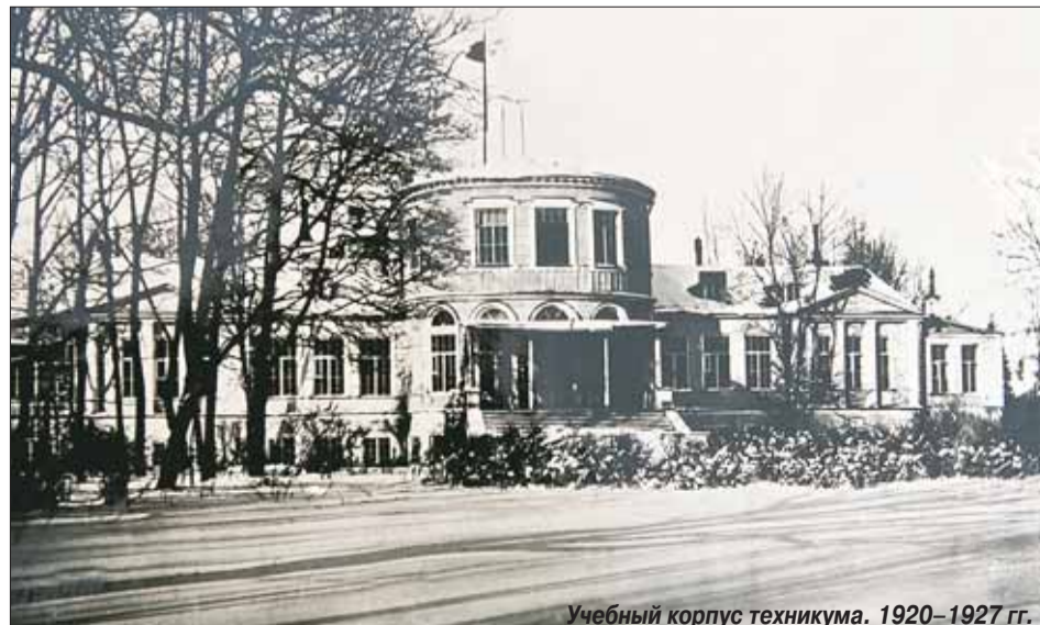
Учебный корпус техникума. 1920–1927 гг.

Узнаете вы из рассказа летописца истории техникума и о том, что затем финский техникум стал финско-эстонским, в котором русский преподавался как иностранный, и так было десять лет, и только в 34-м году преподавание стало вестись на русском языке, сменился и студенческий контингент, и преподавательский состав. И хотя располагался первые годы техникум в бывшей усадьбе Всеволожских, в добротном барском доме, материальная база техникума была более чем скромная: 60 гектаров земли, 10 лошадей, 48 коров, 23 сохи и два плуга. Только через несколько лет появился первый трактор «Фордзон-Путиловец». И вплоть до начала войны специалистов для села готовили только по трем направлениям: первые выпускники были «ученые-зоотехники» (так их называли), затем появилось отделение ветеринаров и агрономов.