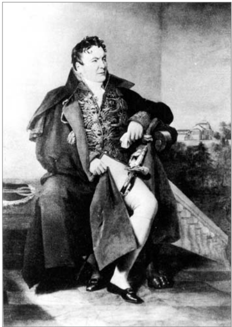
На картине – Всеволод Андреевич Всеволожский. Истории рода Всеволожских уделено большое внимание в работах Г. Я. Вокка.