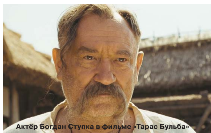
Актёр Богдан Ступка в фильме «Тарас Бульба»