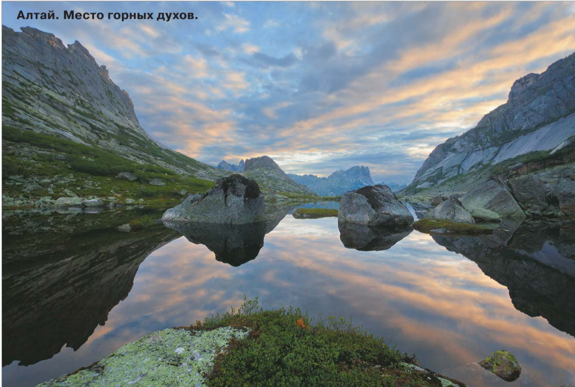
Алтай. Место горных духов.