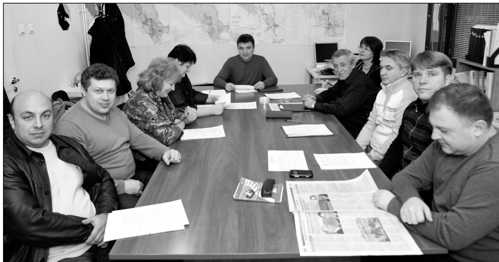
Заседание нового состава Совета депутатов

На общих собраниях собственников ставился вопрос о смене управляющей компании, но боль-