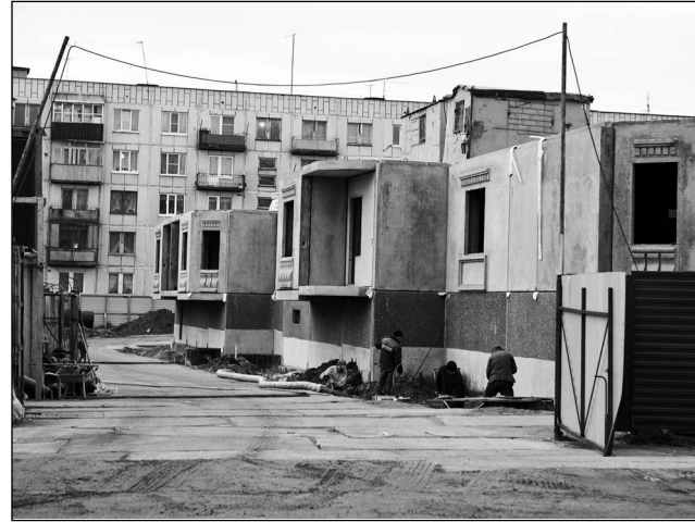
Нина УСТИЧЕВА

Руководство Газпрома приобрело землю под строительство дома с аукциона. Технические условия проекта предусматривают строительство канализационного коллектора, который решит проблемы канализирования и отведения сточных вод от домов, расположенных в районе жилгородка, что улучшит санитарное состояние жилья.