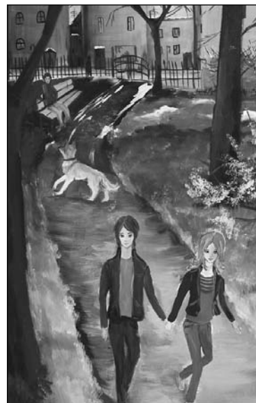
Рисунок Дороховой Алины, 15 лет. Школа искусств пос. Агалатово.