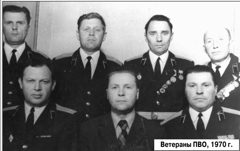
Ветераны ПВО, 1970 г.