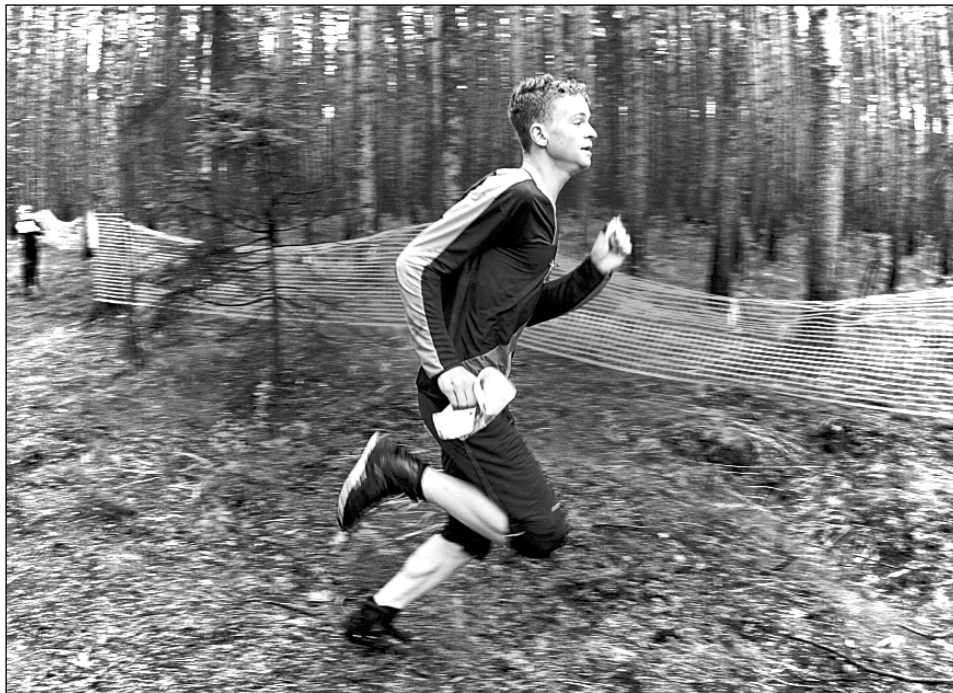
Момент борьбы на дистанции

Владимир ШУСТОВ