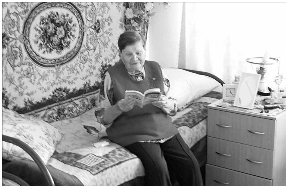
В комнатах дома престарелых светло и уютно