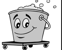
график работы: 2/2, по 12 часов, з/п от 11 000 руб./мес. (на руки).

Б/ПЛАТНАЯ РАЗВОЗКА от п. им. Морозова, Ваганово, Борисова Грива, Ириновка, Рахья, Углово, Корнево, Романовка, Разметелево, Колтуши, ж/д ст. Бернгардовка, ж/д ст. Мельничный Ручей, Котово Поле. ☎ ОК: (812) 347-78-62, 8-921-954-46-89.