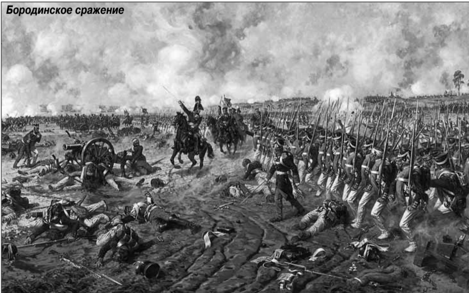
«Недаром помнит вся Россия про день Бородина!» М. Лермонтов