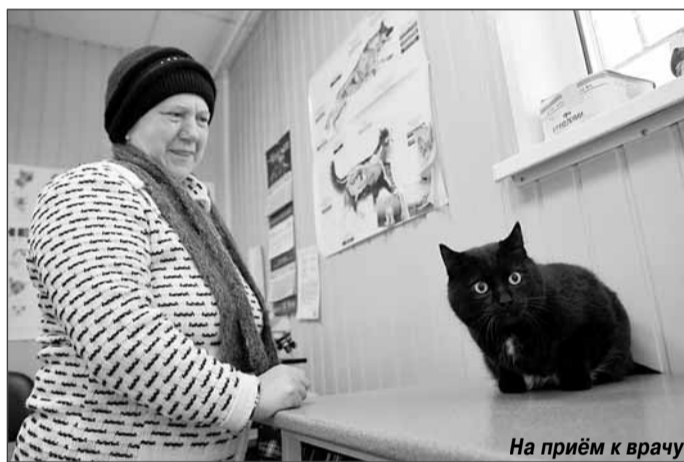
На приём к врачу

Таким образом, вся продукция животноводства, поступа-