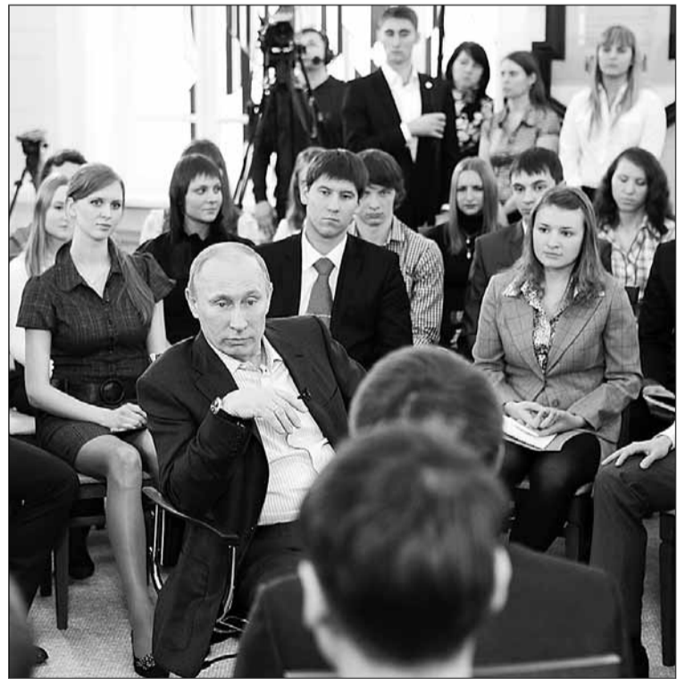
Владимир Путин на встрече с томскими студентами

Понятно, что насильно заставить людей выбирать, например, рабочие специальности, невозможно. Но рыночная экономика сама всех учит. Когда какой-нибудь очередной менеджер сидит три месяца без зарплаты, он волей-неволей начинает думать о том, не пора ли сменить профессию. На производстве, где я работаю, начинающий техник получает от 30 тыс. рублей в месяц. И знаете что – очередней на свободные вакансии я не наблюдаю.